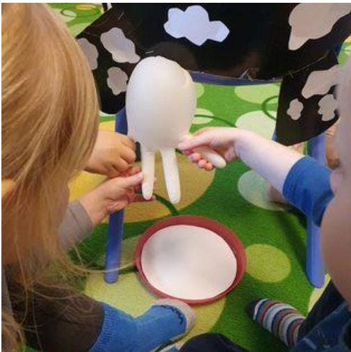
Umíme i dojit