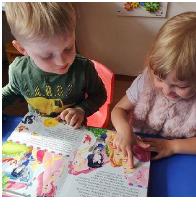
Čteme si v knížkách