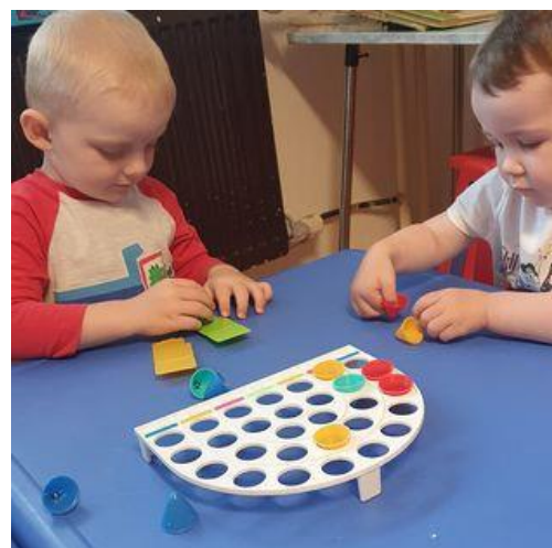
Hrajeme i staré hry